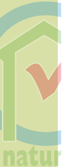
Grafik: natureplus e.V.

Dämmstoffe aus nachwachsenden Rohstoffen konnten hingegen gar nicht zum Brennen gebracht werden. Durch die zugesetzten Flammschutzmittel verkohlen die Dämmstoffe äußerlich. Der zum Brennen erforderliche Sauerstoff kann deswegen nicht in den inneren Teil des Dämmstoffes vordringen, wodurch ein Brennen verhindert wird.